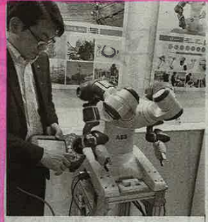
人と一緒に作業できる協働型ロボット